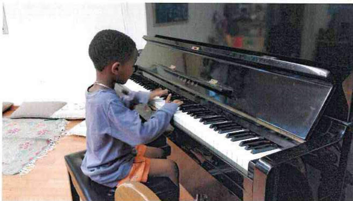
בית בטבע, תל אביב ברברה אנדרס

יצירת אינטראקציות אינטנסיביות שמטפחות שליטה בשפה וכישורים של פתרון בעיות