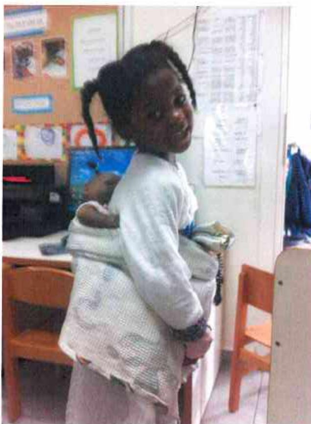
גן "שעורה" הגנת סוּוּתָה טיחוסטוף הסייעת נחמה אהרון