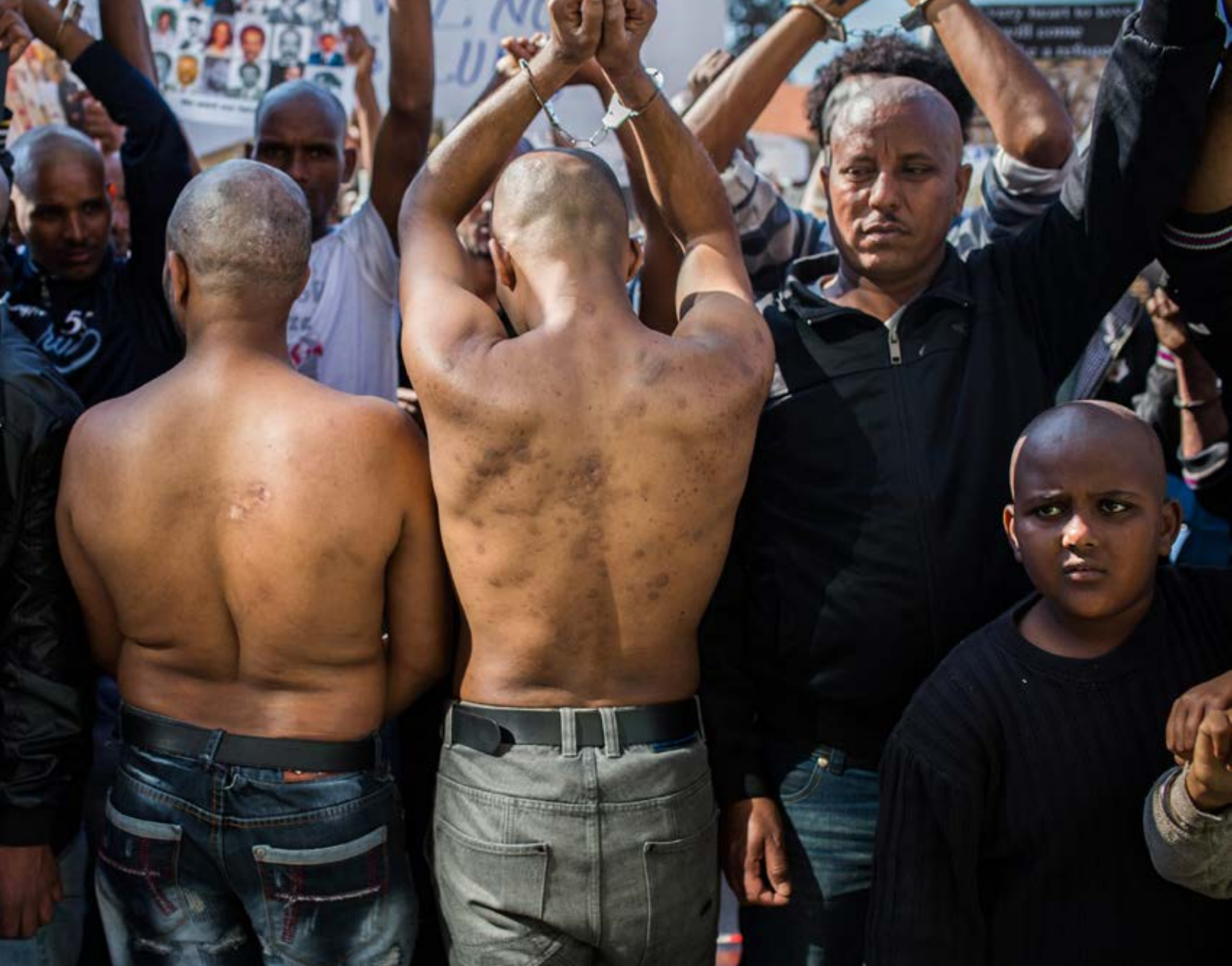
קורבנות עינויים בהפגנה למען זכויות פליטים מול משרד הפנים בתל אביב, בפברואר