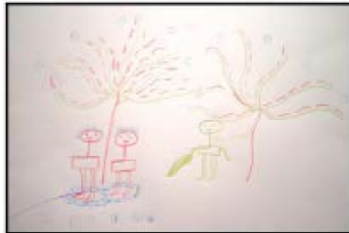
ציור של מבקשת מקלט קורבן עינויים שצויר במסגרת קבוצת התמיכה לנשים קורבנות עינויים

עם תחילת שחרור קורבנות הסחר לעמותת א.ס.ף התריעה זו בפני הרשויות כי אין זה מתפקידה ואין זה ביכולתה להעניק טיפולי תמיכה וליווי ראויים ומספקים לקורבנות הסחר והעבדות. בפגישה עם גורמים רשמיים ממשרד הרווחה וממשרד המשפטים וכן במכתבים אליהם העמותה דרשה כי המדינה תיקח אחריות על קורבנות הסחר המוכרים גם בזמן המתנתם בקהילה לשיקום. 21 באוקטובר 2013 נפתח ע"י משרד הרווחה מרכז יום ייעודי לטיפול בנשים קורבנות סחר ועבדות הממתינות למקום במקלט של המדינה. מרכז היום נמצא במסיל"ה (מרכז סיוע לקהילה הזרה של עיריית תל אביב) והשירותים ניתנים בו על ידי עובדת סוציאלית. לקראת סוף שנת 2013 נפתחו שירותי המרכז גם לגברים קורבנות סחר. בחודש מאי 2013, בעקבות דיון בוועדה לקידום מעמד האישה, אישר שר הרווחה העברת תקציב של מיליון וחצי שקלים להקמת מקלט נוסף לנשים קורבנות סחר בבני אדם. 22 הקמת המקלט התעכבה מספר חודשים ובסופו של דבר הוא נפתח לפעילות בחודש דצמבר 2013.